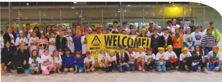
Des enfants et participants posent pour une photo à un événement de Sécurijour à Carberry, au Manitoba.

Plus de 70 événements sont prévus au Canada en 2012 dans les communautés rurales. Les communautés choisissent des activités spécifiques en fonction des enjeux ruraux locaux, comme se protéger du soleil, reconnaître et éviter l'exposition aux produits chimiques et la manipulation sécuritaire des animaux.